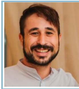
Pagano Michele Marketing